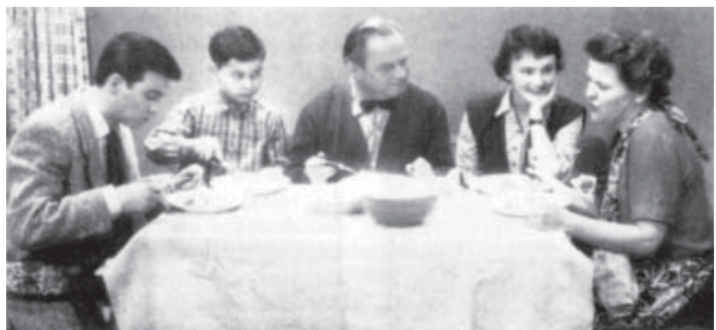
Der westliche Wertekonsens beim Mittagessen

Rassistische Konzepte versuchen reale oder eingebildete soziale Ungleichheiten zwischen Menschen unterschiedlicher Ethnien über angeblich natürliche Unterschiede zwischen diesen Ethnien zu erklären. Ursprüngliche rassistische Konzepte operierten dabei mit behaupteten genetischen Dispositionen: Menschen gehören zu unterschiedlichen Rassen, diese sind unterschiedlich genetisch bestimmt und in Folge dieser genetischen Unterschiede unterschiedlich begabt oder auch mit unterschiedlichen charakterlichen Eigenschaften ausgestattet. Diese klassischen und offensichtlich dummen Erklärungsansätze sind mit der Niederschlagung des Faschismus weitgehend