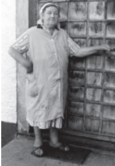
Die westliche Wertegemeinschaft unterm Kopftuch

Selbst aber wenn Deutschland in Zukunft den Sprung in den internationalen Durchschnitt schaffen würde, gäbe es noch ganz andere Probleme, die einem emanzipatorischen Bildungssystem im Wege stünden. Dies haben zum Beispiel die Studierenden im Rahmen ihrer Proteste auch erkannt – allerdings hat man sich hier zu sehr auf die Forderung nach mehr Staatsknete für die Hochschulbildung sowie ein Verbot von Studiengebühren eingeschossen. Bildung wird größtenteils als