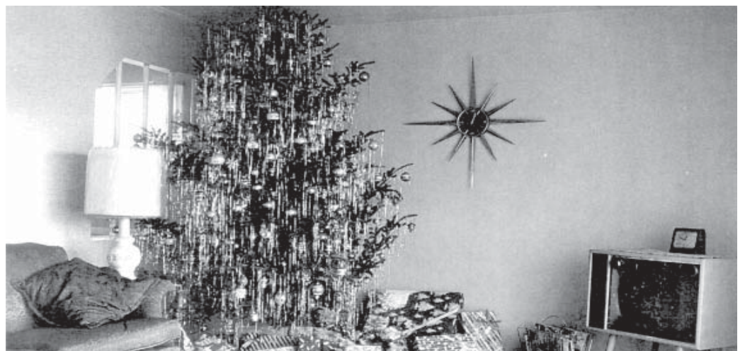
Die westliche Wertegemeinschaft feiert ihre Feste

N: Hm, es ging weniger um eine politische Ebene. Es hatte mehr damit zu tun, dass Leute glaubten, ich würde als eine Art Robin Hood auftreten wollen, weil man mich immer wieder so kennen gelernt hat. Da ich mich während und nach der Ausbildung immer wieder für andere Leute eingesetzt habe, mich bei Schwierigkeiten mit dem Arbeitgeber eingemischt habe, sagten die Leute: jetzt versucht die das auf einer viel höheren Ebene zu zeigen, dass es gar nicht so schlimm ist, mit einem Kopftuch zu arbeiten oder ähnliches. Mit Politik hatte das damals, glaube ich, gar nichts zu tun gehabt. Daran habe ich persönlich auch nicht gedacht.