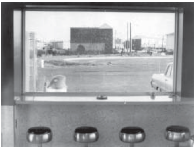
Die westliche Wertegemeinschaft auf dem Klo