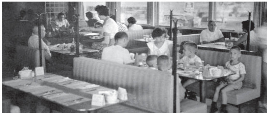
Die westliche Wertegemeinschaft beim Essen III