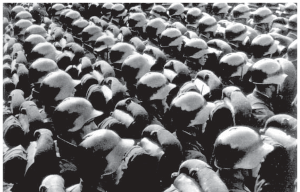
Die westliche Wertegemeinschaft in Reih und Glied.

Die hessische Landesregierung rühmt sich, dass mehr als 20 Prozent aller in Deutschland bislang eingerichteten Bachelor- und Master-Studiengänge von hessischen Hochschulen angeboten werden. Die Neufassung des Hessischen Hochschulgesetzes (HHG) sieht deren reguläre Einführung vor. Doch die intendierte Folge ist nicht die hessischen Hochschulen besonders offen für europäische Studierende zu gestalten. Denn die Novelle plant gleichzeitig, dass von „ausländischen Studierenden“ Gebühren für „besonderen“ Betreuungsaufwand erhoben werden können. Mit der forcierten Einführung von BA/MA steht eher zu befürchten, dass die Einführung eines Zwei-Klassen-Studiums vorbereitet wird. Die Schaffung sogenannter „Premium-Master-Studiengänge“, für die Studiengebühren erhoben werden können, legt das zumindest nahe. Ein Schelm wer sich zudem bei der Einführung von Eignungsprüfungen nach den ersten zwei Semestern eine immer undurchlässigere Hochschule vorstellt.