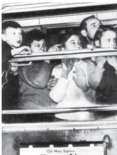
Nicht jeder kann 1. Klasse fahren - Bildungspolitik in Hessen

Hessen - Sie verlassen den demokratischen Sektor! Thomas Balzer schreibt über die hessischen Pläne zur Deform der Hochschuldemokratie.